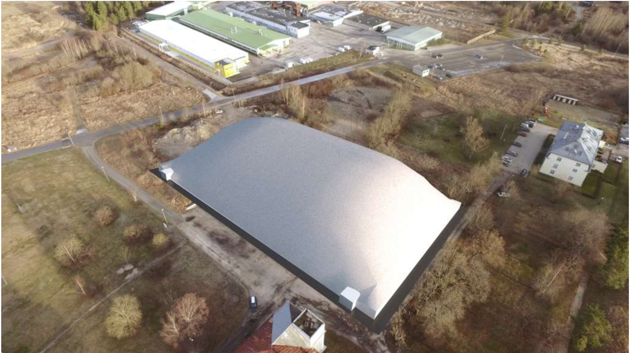
Vaade jalgpalliväljakule pneumohalliga kaetud perioodil.