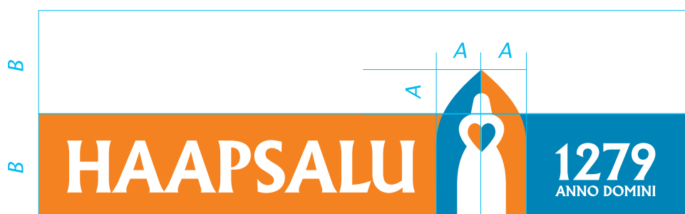
Horisontaalse logo konstruktsioon ja minimaalne turvaala