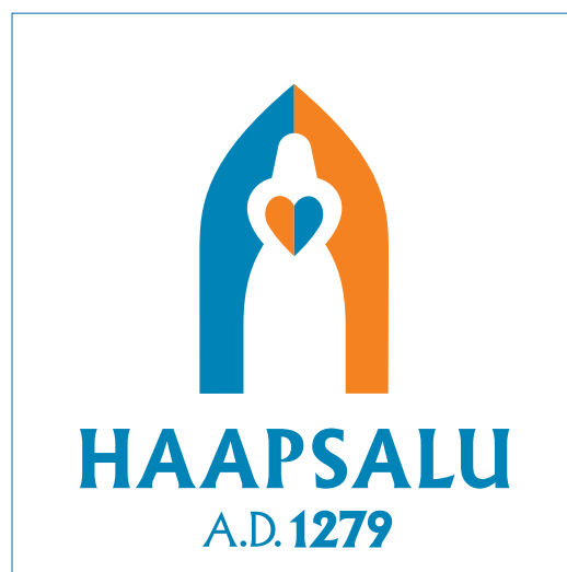
Vertikaalse logo minimaalne turvaala